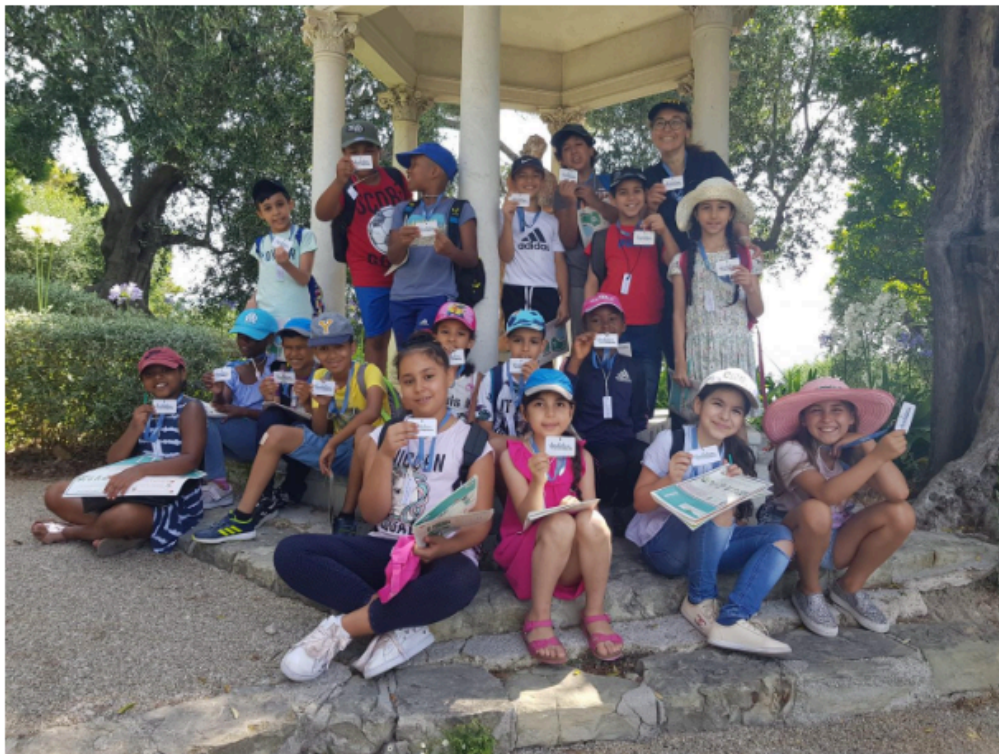
La vingtaine d'enfants et leur professeur ont apprécié cette parenthèse enchantée dans leur quotidien. A.-P. B.

📍 NICE #VIE LOCALE | PAR AGNÈS PASQUETTI-BARBERA | Mis à jour le 10/07/2018 à 10:15 | Publié le 10/07/2018 à 05:01